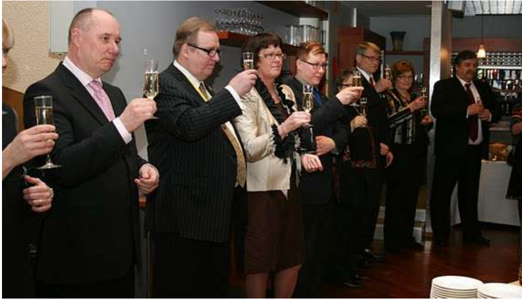
Malja yhteiselle vuosijuhlallemme Scandicissa 19.3.2011.