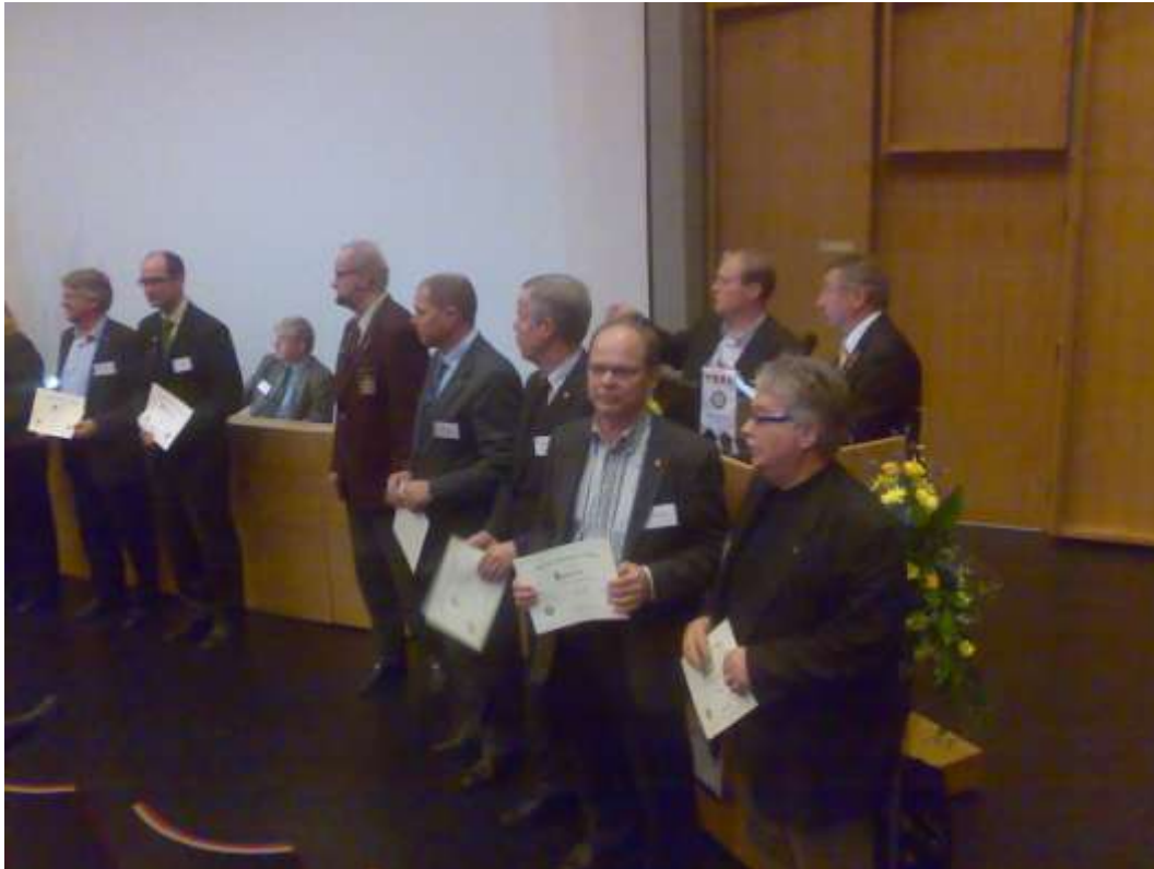
Molemmat forssalaisklubit palkittiin syysseminaarissa 2.10.2010 lahjoituksista yhteisiin rahastoihimme.