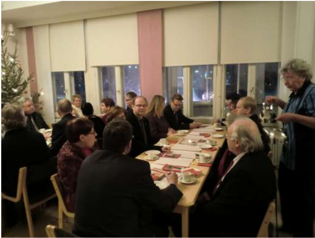
Jouluhartaus 16.12.2010 Forssan kirkossa ja juhlallinen joulukahvitus Pappilassa.