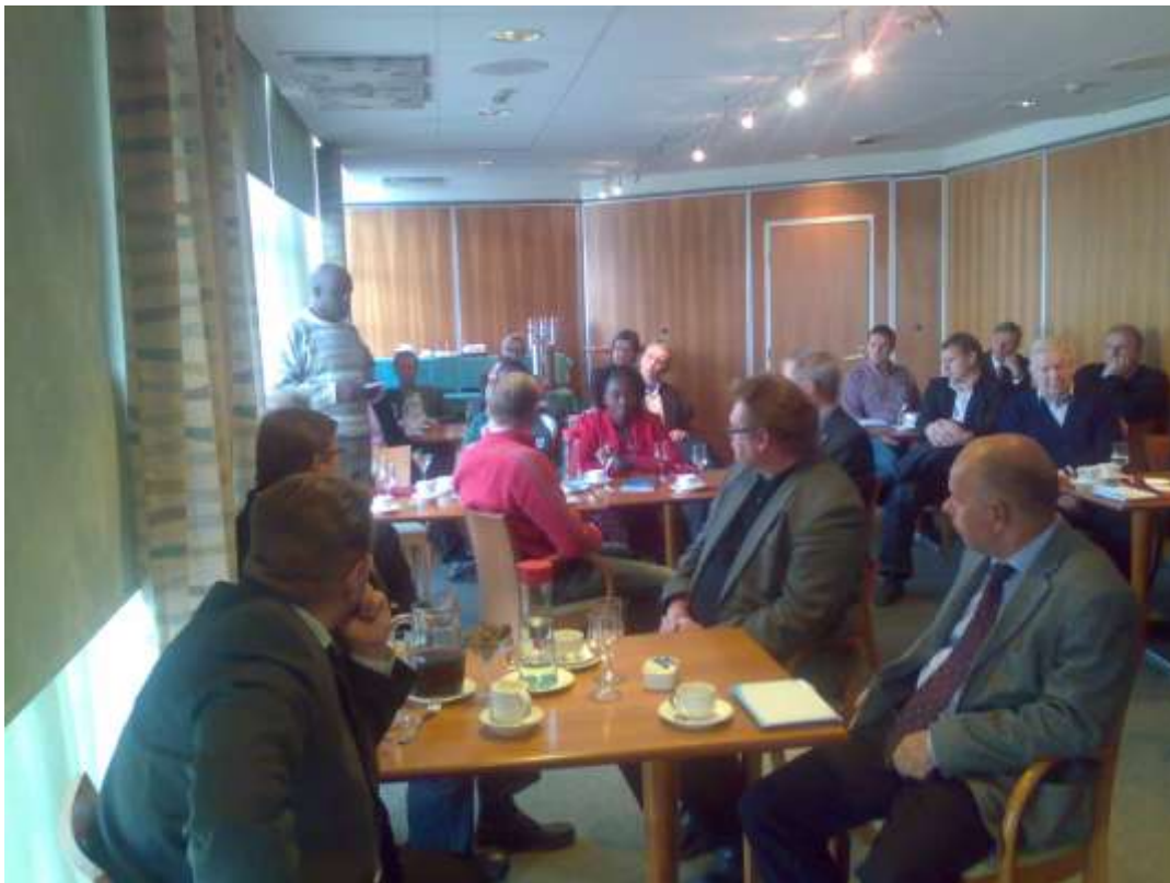
Vieraita Keniasta, viikkokokous 12.10.2010.