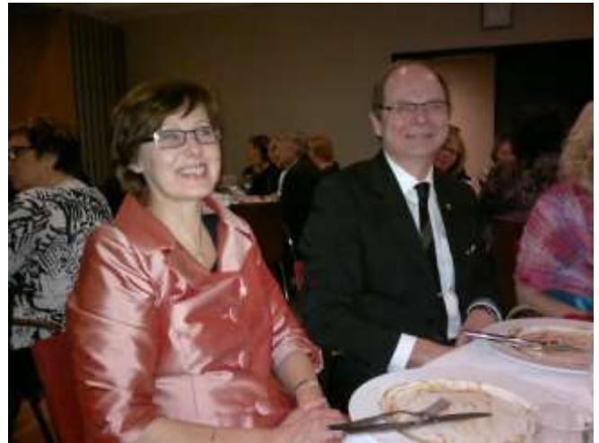
Piirikonferenssi Down By the Laituri Turussa 9.-10.4.2011 oli Rotaryvuoden huipputapahtuma korkeatasoisine luentoineen ja hienoine iltajuhlineen.