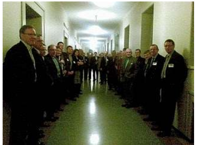
Maa- ja metsätalousministeri Sirkka-Liisa Anttilan vieraana Eduskuntatalolla 27.1.2011.