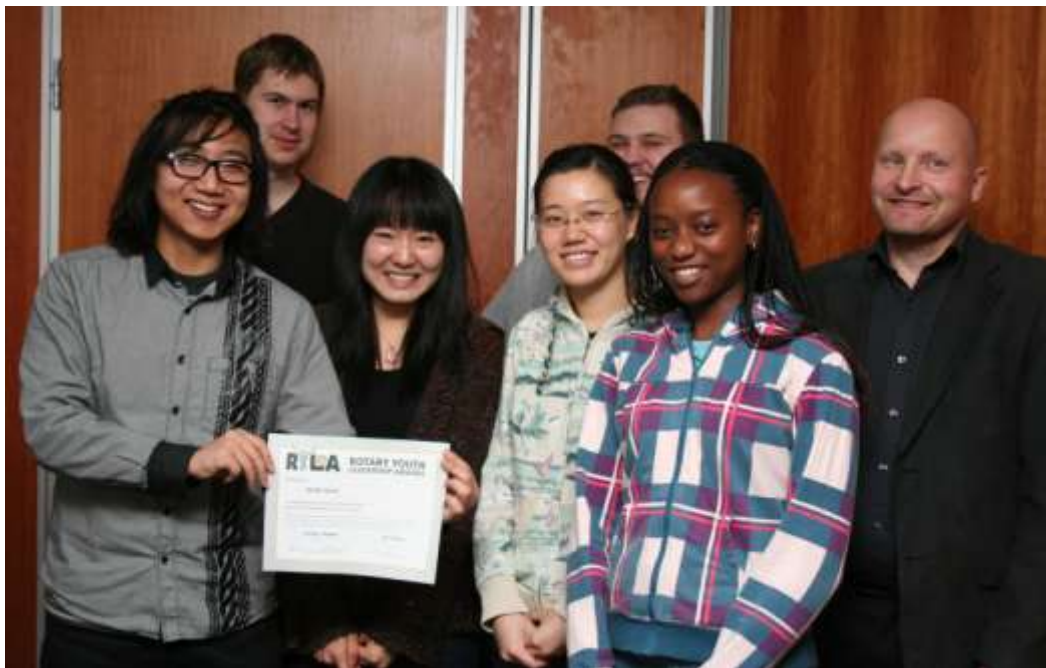
Uusittu RYLA-koulutus Forssassa

Piirin 1410 alueen 5 klubit: Alastaro, Forssa, Forssa Sepänhaka, Loimaa, Somero ja Urjala, ovat yhteistyössä pitäneet jo useamman RYLA-koulutuksen. Vuoden 2010 koulutus oli kuitenkin koulutusten joukossa urauurtava ja uusia toimintamuotoja etsivä. Yhteistyössä Hämeen ammattikorkeakoulun Forssan yksikön kanssa pidettiin kahdeksan korkealaatuista asiantuntijaseminaaria opiskelijoille englanniksi.