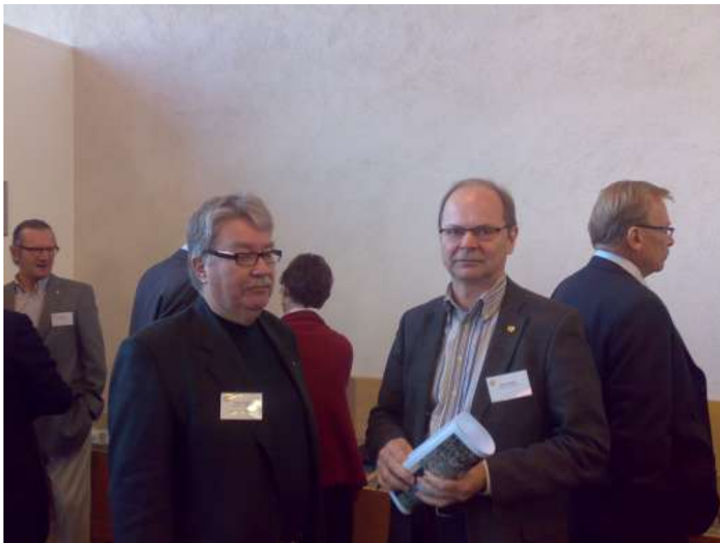
Forssan Pressat syysseminaarissa Kemiönsaarella 2.10.2010.