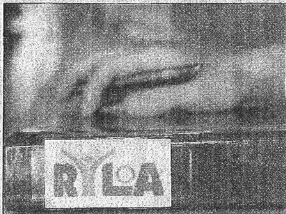
Rotareiden nuorten johtajakoulutus tunnetaan lyhenteellä RYLA (Rotary Youth Leadership Awards).

– Ideana on antaa nuorille johtajataitoja, esiintymiskykyjä,